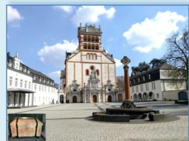
Trier, Abtei St. Matthias

Verantwortlich für den Inhalt und weitere Informationen: